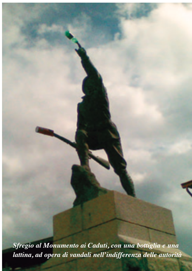
Sfregio al Monumento ai Caduti, con una bottiglia e una lattina, ad opera di vandali nell'indifferenza delle autorità

no ai "nonni" e quanto sia profondo il valore educativo di questi incontri. Quando raggiungiamo le persone, la gente capisce chi siamo. È stata la gente, a Modena, a dare vita alla manifestazione. Le rappresentanze combattentistiche, d'arma e del volontariato erano presenti con spontaneità. Il Paese c'era. Ci auguriamo che la viva emozione con cui l'evento è stato seguito si possa percepire tra le righe della cronaca che segue; un'emozione che è stata pure ampiamente raccontata nei tanti articoli usciti sui quotidiani e nelle eloquenti foto pubblicate sui siti internet e nelle TV nazionali e locali. Tutto questo ci incoraggia a pensare che la nostra ANRP non può morire. Tutti quelli che hanno partecipato possono testimoniare come certe sollecitazioni possano costituire un efficace collante di coesione e di identità. Un passaggio del testimone. Il testimone è la bandiera. Arrivederci (forse) a Campobasso!